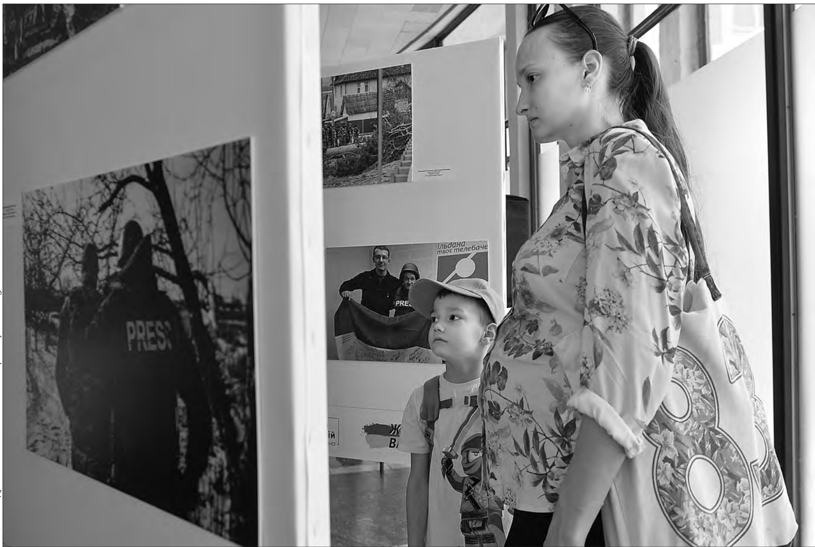
Фото Андрія НЕСТЕРЕНКА. Більше фото тут — www.golos.com.ua

Виставку до Дня журналіста розгорнуто в холі станції метро «Золоті ворота».