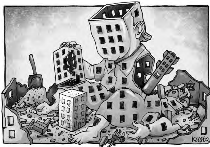
Вічні янголи. За 8 років російсько-української війни загинуло 152 дитини, а з початку повномасштабного вторгнення ще 485 невинних дитячих душ відлетіли у вічність.