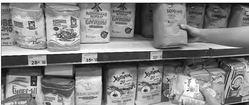
Борошно залишається одним із найдешевших продуктів вітчизняних аграріїв. Але через постійне зростання собівартості вирощування втримувати ціни на нього дедалі важче.

Та, як би там не було, а вартість каші тепер залежатиме ще й від того, скільки ракет і дронів ворог випустить на нас. Навіть якщо вони не зашкодять полям, то на роботу аграріїв ворожі атаки впливають.