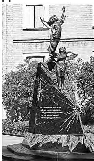
ПОЧАТОК НА 1-Й СТОР.

Перша леді України Олена Зеленська, яка взяла участь у відкритті меморіальної композиції, зазначила: «Важко відкривати пам'ятники загиблим. Особливо якщо ці загиблі — діти. Адже діти мають жити. Як мали жити маленькі мешканці багатоповерхівок в Умані, Дніпрі, Херсоні, Запоріжжі, десятків розбитих російськими ракетами будинків по всій країні. Повинні були жити всі пасажирів автівок з написом «Діти», розстріляних окупантами. Не повинні плакати ані харківський тато — над сином,