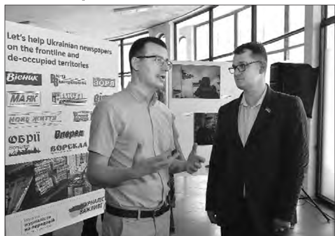
Голова Національної спілки журналістів України Сергій Томіленко, перший заступник голови Комітету з питань свободи слова Євгеній Брагар.

За словами голови Національної спілки жур-